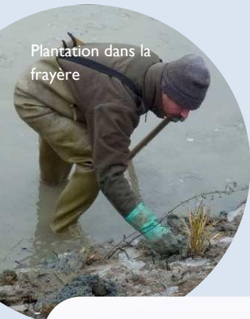
Plantation dans la frayère

Le syndicat, en partenariat avec l'AAPPMA (Association Agréée de Pêche et de Protection du Milieu Aquatique) de Rémilly et la Fédération de Pêche de la Moselle, réalise un suivi technique de la frayère pour déterminer les atouts et les faiblesses du milieu, et adapter au plus juste la gestion du site. D'importants travaux ont été réalisés en fin 2013 : le milieu a besoin d'un peu de temps pour retrouver un stade d'équilibre. Cependant, les relevés effectués cette année sont positifs puisqu'un certain nombre de paramètres sont favorables à la reproduction des poissons et notamment du brochet. Pour accélérer l'installation d'un milieu favorable, le syndicat a planté entre l'automne 2013 et le printemps 2014, 800 plantes semi aquatiques (hélrophytes) servant de support de ponte dans la frayère.