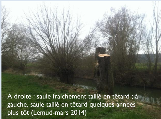
A droite : saule fraîchement taillé en têtard ; à gauche, saule taillé en têtard quelques années plus tôt (Lemud-mars 2014)

Depuis 2011, un nouveau programme d'entretien est en cours. Le linéaire est réparti en 3 tronçons afin de fractionner les interventions et les coûts. C'est ainsi que chaque année, une dizaine de kilomètres de cours d'eau sont traités.