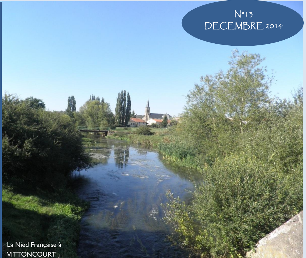
La Nied Française à VITTONCOURT

ADAINCOURT ANCERVILLE BAZONCOURT COURCELLES-CHAUSSY COURCELLES-SUR-NIED LAQUENEXY LEMUD LESETANGS MAIZEROY PANGE REMILLY SANRY-SUR-NIED SILLY-SUR-NIED SORBEY VITTONCOURT VOIMHAUT