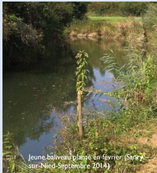
Jeune baliveau planté en février (Sanry - sur-Nied-Septembre 2014)