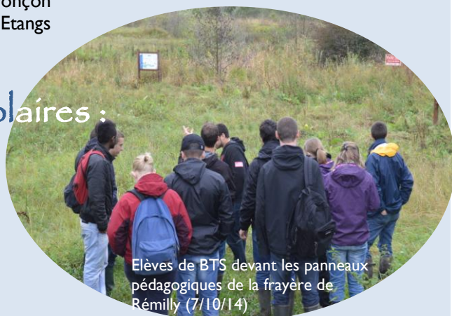
Elèves de BTS devant les panneaux pédagogiques de la frayère de Rémilly (7/10/14)

Le technicien du Syndicat est intervenu dans une classe de seconde et une classe de BTS pour sensibiliser les élèves aux milieux aquatiques. Le syndicat a signé également un partenariat avec le lycée agricole de Courcelles-Chaussy pour lutter contre une espèce indésirable qui envahit nos cours d'eau : la Renouée du Japon. Le technicien a réalisé plusieurs interventions dans l'établissement pour suivre ce projet. ; il est également intervenu dans une classe de CE2 et une classe de CMI sur le syndicat voisin de la Nied Réunie.